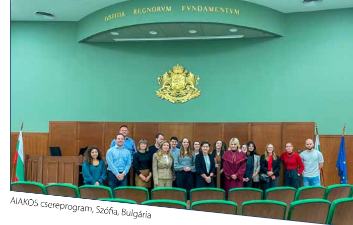
AIAKOS csereprogram, Szófia, Bulgária

„Az EU csak akkor működőképes, ha erős a tagállamok lakói közötti kapcsolat. egy osztrák bíró – regionális csereprogramon Olaszországban