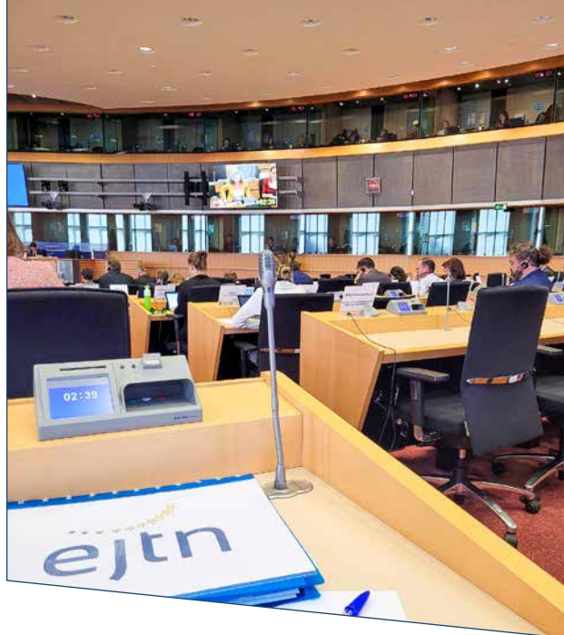
Tanulmányút az Európai Unió intézményeihez, Brüsszel, Belgium