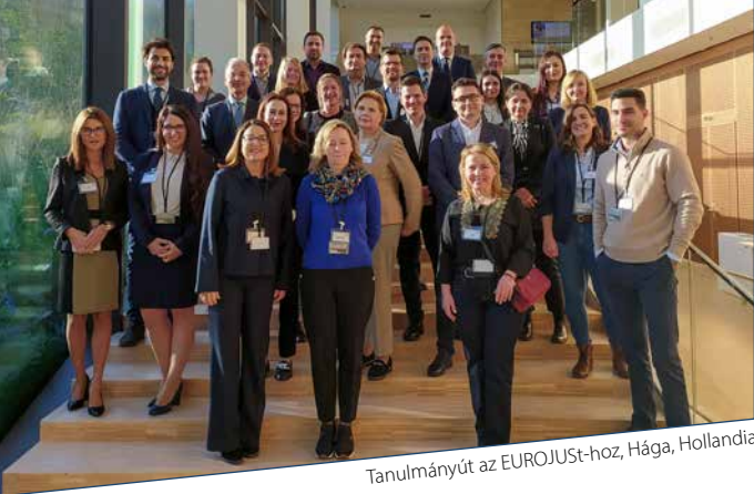
Tanulmányút az EUROJUST-hoz, Hága, Hollandia