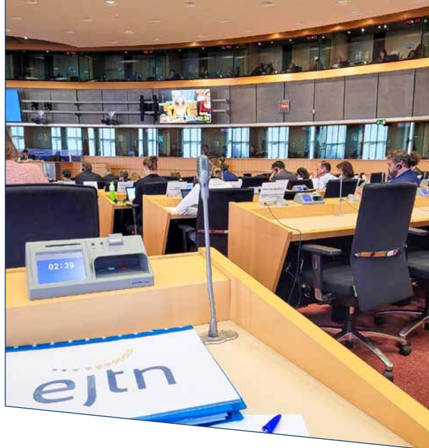
Εκπαιδευτική Επίσκεψη στους Ευρωπαϊκούς Θεσμούς, Βρυξέλες