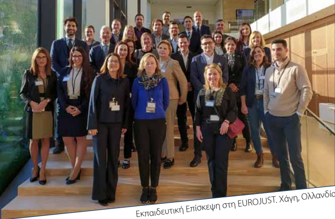
Εκπαιδευτική Επίσκεψη στη EUROJUST, Χάγη, Ολλανδία