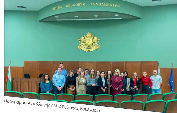
Πρόγραμμα Ανταλλαγής ΑΙΑΚΟΣ, Σόφια, Βουλγαρία