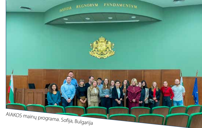
AIAKOS mainų programa. Sofija, Bulgarija

„ES gali veikti tik tada, kai valstybių narių gyventojai palaiko virtus santykius. Austrijos teisėjas - Regioniniai mainai Italijoje“