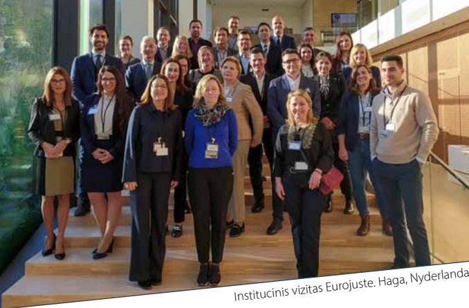
Institucinis vizitas Eurojuste. Haga, Nyderlandai