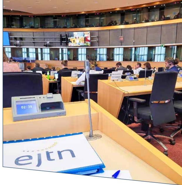
Institucinis vizitas ES institucijose. Bruselis, Belgija